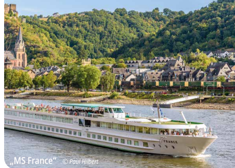
„MS France“