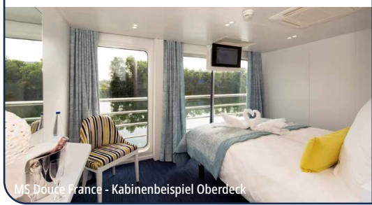
MS Douce France - Kabinenbeispiel Oberdeck

Alle Kabinen sind Außenkabinen mit einer Grundfläche von ca. 10 m 2 bis 14 m 2 . Zur Ausstattung gehören Dusche/WC, individuell regulierbarer Klimaanlage, Safe, Radio, Hausteleson, Föhn, Fernseher und Panoramafenster. Alle Kabinen sind mit 2 Betten ausgestattet, welche entweder getrennt oder – als französisches Bett – zusammenliegend angeordnet sind. Bei Achternkabinen handelt es sich um Kabinen, die im hinteren Teil des Schiffes liegen und sich am nächsten zum Maschinenraum befinden.